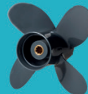
Elica in alluminio a 4 pale