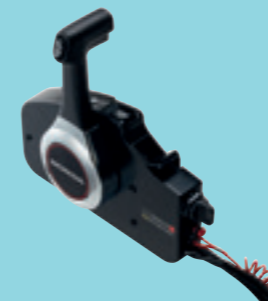
Scatola comandi a fissaggio laterale