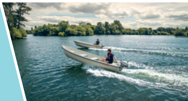
Nonostante le dimensioni contenute, questi motori garantiscono una ottima coppia e potenza.