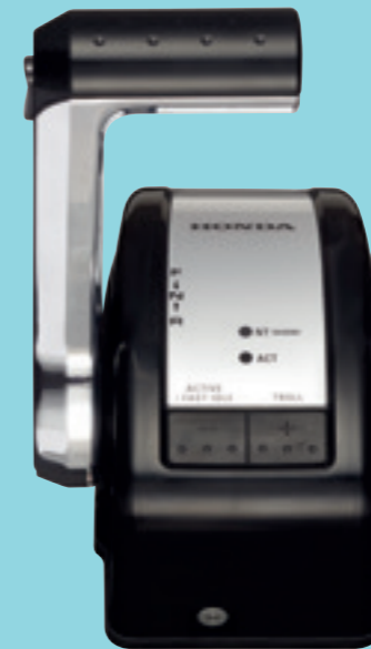
Honda iST (leva singola)

Il sistema di comando e controllo iST è disponibile su tutti i modelli V6, per un controllo senza paragoni ed una installazione semplice. Il sistema offre tutte le caratteristiche che i diportisti cercano, tra cui la modalità di minimo veloce, il trolling control e la sincronizzazione del regime di rotazione e dei trim fino a 4 motori in contemporanea.