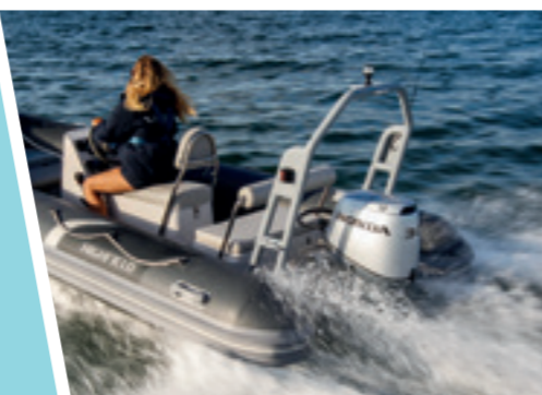
Questi motori possono essere gestiti con consolle che con barra.