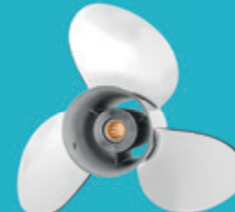
Elica in acciaio inossidabile a 3 pale