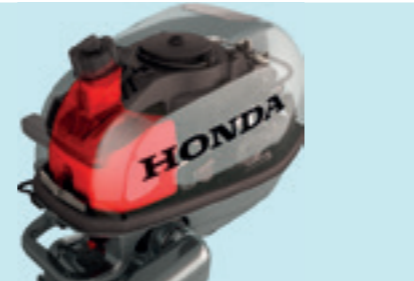
I nuovi motori della gamma BF4/5/6 sono stati progettati specificamente per integrare un serbatoio carburante di maggiori dimensioni (1,5 l).