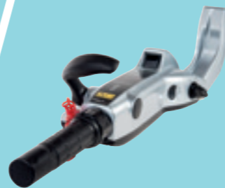
Barra di comando multifunzione

Per i nuovi motori V6 grazie al nuovo sistema iST (intelligent Shift & Throttle) è possibile l'avviamento e lo stop attraverso un singolo pulsante.