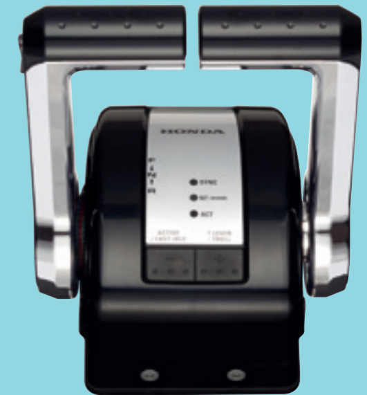
Honda iST (doppia leva)