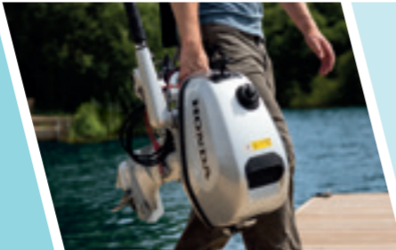
I motori BF4/5/6 possono essere facilmente movimentati grazie alla maniglia integrata.