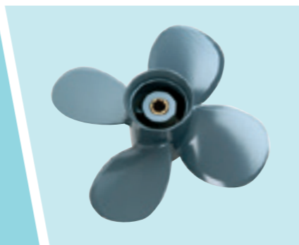
Su richiesta, è disponibile l'elica Power Thrust che consente l'installazione di questi motori anche su imbarcazioni di stazza maggiore.