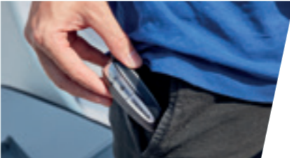
Il sistema di sicurezza Immobilizer è stato progettato per evitare che il motore possa essere avviato senza la chiave remota del proprietario.