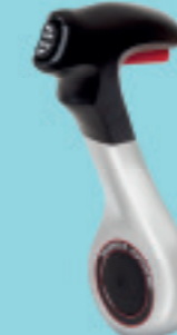
Scatola comandi con montaggio a filo