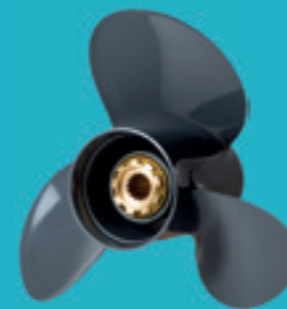
Elica in alluminio a 3 pale