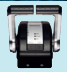
Honda iST (Intelligent Shift & Throttle) fino a 4 motori.