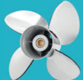
Elica in acciaio inossidabile a 4 pale