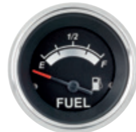
Indicatore analogico livello carburante