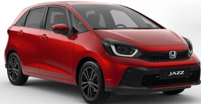
Rosso Premium Crystal