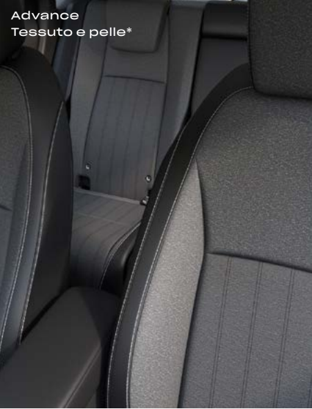
Advance Tessuto e pelle*