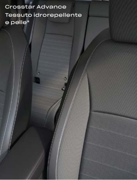
Crosstar Advance Tessuto idrorepellente e pelle*