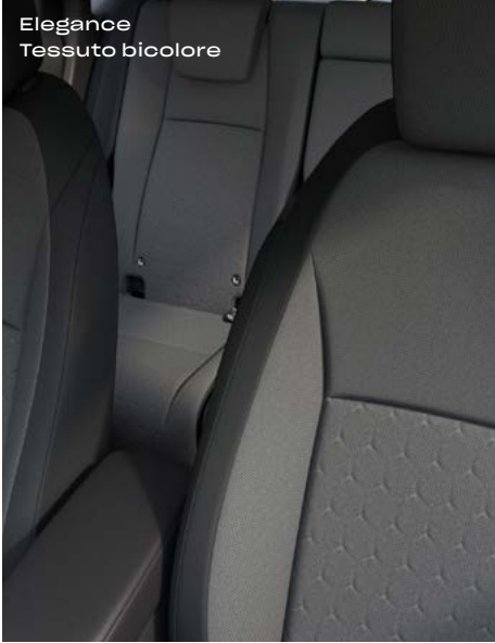
Elegance Tessuto bicolore