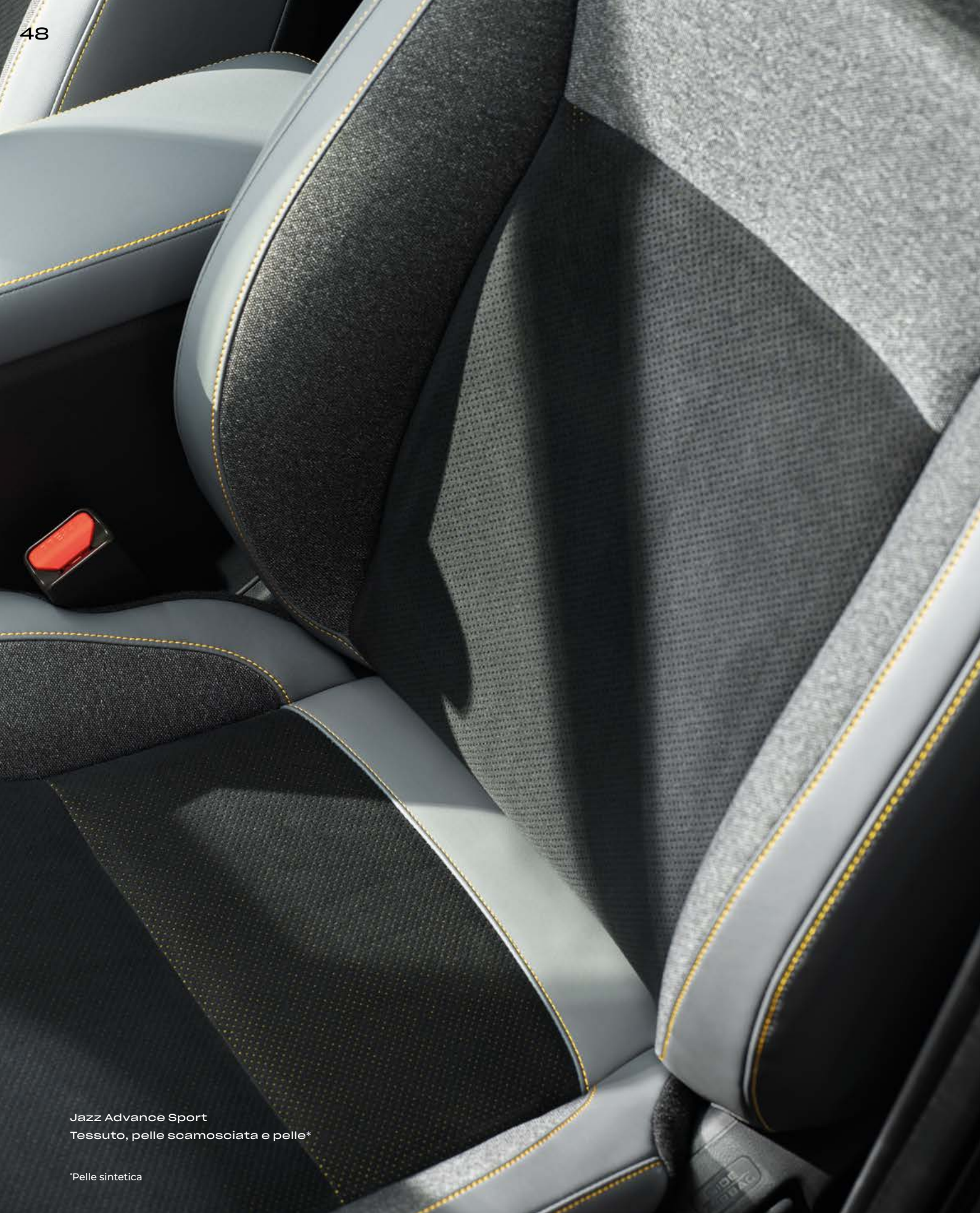
Jazz Advance Sport Tessuto, pelle scamosciata e pelle*